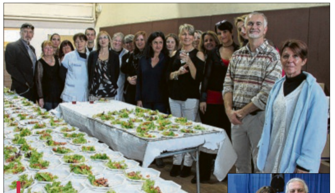
Une belle équipe a œuvré en coulisses pour préparer ce repas des anciens.